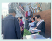
경로식당 배식, 퇴식봉사